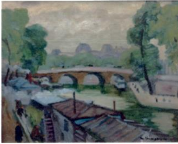
島村三七雄（1904～1978年）「サンミッシェルの橋」 油彩・キャンバス F5号（27×35cm） 制作：1929～1937年 滞欧作品

1974年 日動サロン 島村三七雄「若き日のパリ」展出品作 印象派の絵画からの影響を受けて描写した作品と思われる。 1945年独立美術協会会員、1957年新樹会会員、1967年日本芸術院賞受賞 1969年東京芸術大学教授