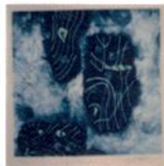
紙面の都合上10葉のうち3葉

二見彰一（1932年生）「Vom Meer（海から）」アクアチント・紙 銅版画集 10葉 12.0×12.0cm 制作年：1989年