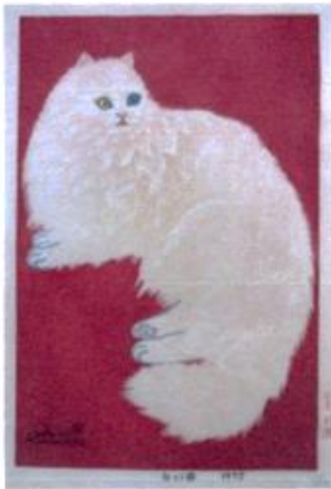
笠松紫浪（1898～1991） 「白い猫」木版画 37×24cm