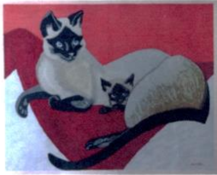
関野準一郎（1914～1988年） 「シャム猫」木版画 36×45cm

猫ブームにあやかってコレクションしたうちの2点。 笠松、関野ともに新版画界の巨匠。特別な説明も必要ないだろう。見事の一言！